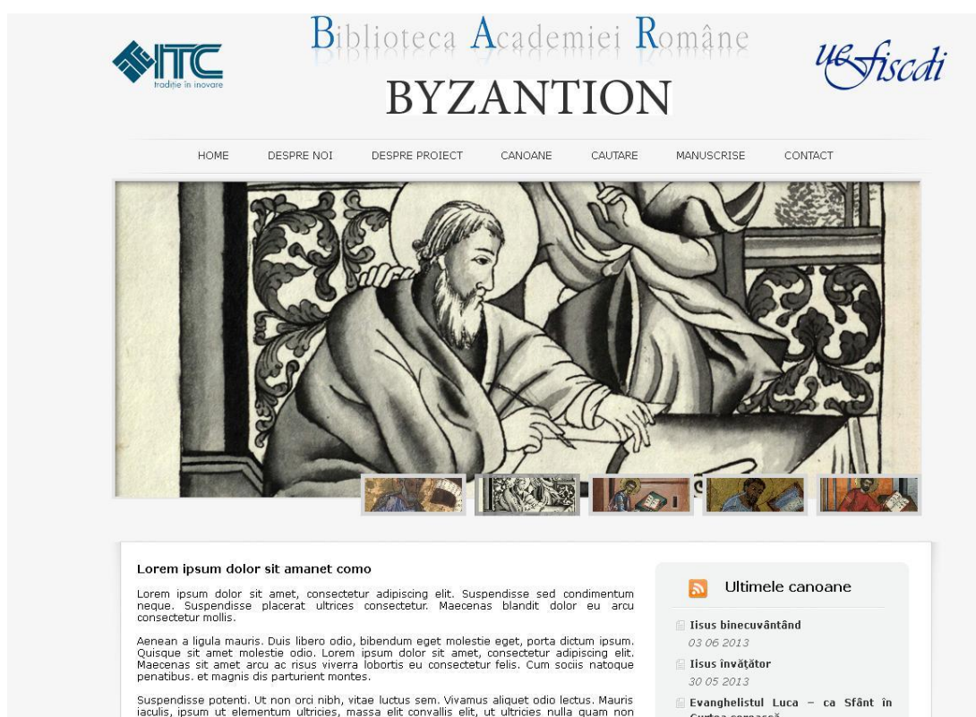
Figura 1 Pagina prezentare BYZANTION