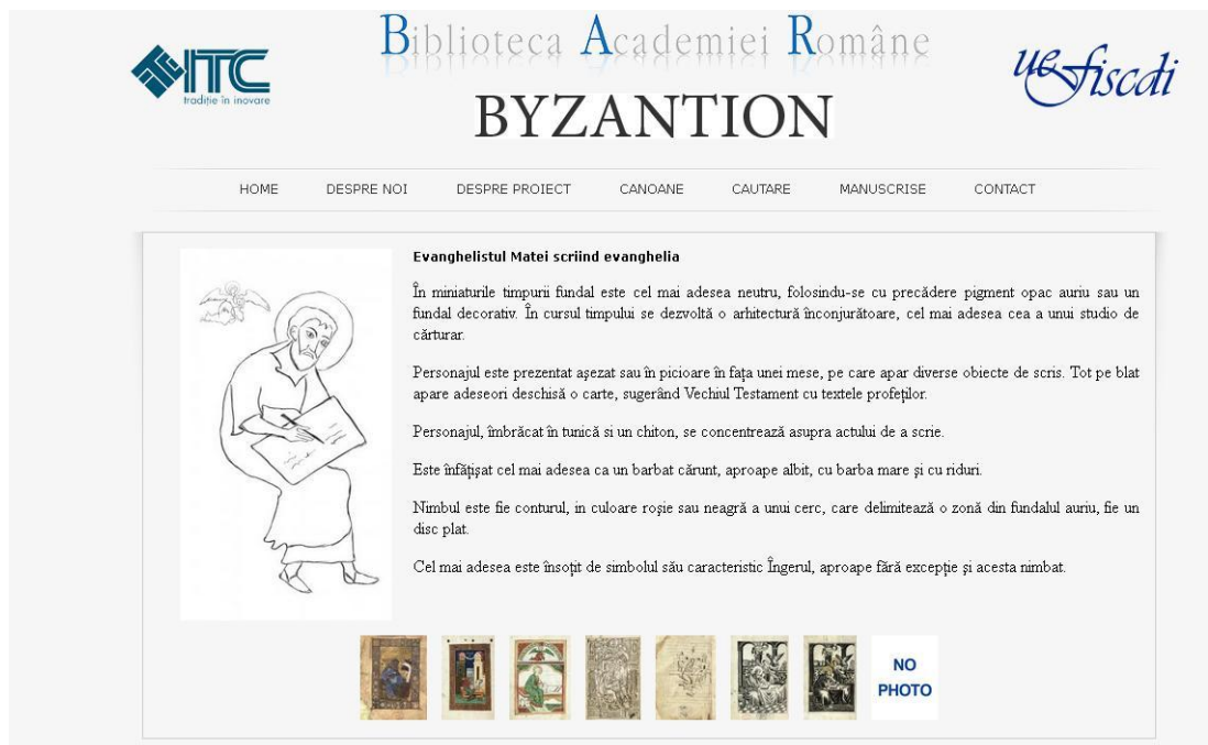
Figura 3 Criterii interogare/selectie evanghelisti